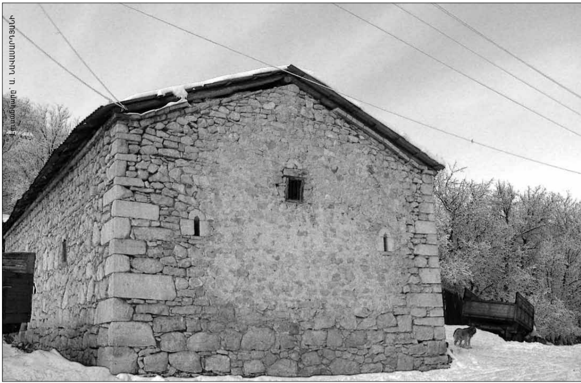
Ուժանիսի Սուրբ Զովհաննես եկեղեցին

ՊԱՏԱՎԱՆ ՏԵՂԵԿԱՆԵՐ Սյունիքի մարզի Ուժանիս գյուղը գտնվում է Կապան մարզկենտրոնից 12 կմ հյուսիս-արևելք: Զևուս կազմել է Մեծ Զայքի Սյունիք աշխարհի Բաղը-Քաշունիք գավառի մի մասը: Առաջին անգամ հիշատակվում է Ստ.Օրբելյանի մոտ Կաթունիք, ապա Գ.Ալիշանի մոտ Կաթունիք, այնուհետև՝ Վժանիս, Վժնիս անուններով: Ուժանիսում է գտնվում Ս.Զովհաննես միանավ եկեղեցին՝ կառուցված 1873 թվականին: Այսօրեցի ոչ հեռու գտնվում են Զին Ուժանիս, Սպիտակ աղբյուր եւ Շենաբեղ բնակավայրերը: Գյուղից 1 կմ հյուսիս-արևելք գտնվում է Զաննին արտ կոչվող վայրը, որտեղ ընդարձակ գերեզմանատեղի կա, իսկ վերջինիս կենտրոնում՝ գեղեցիկ գարդաբանդակներով մաքուր-խաչքար, որն այժմ գտնվում է կիսավեր վիճակում: Ուժանիսում հյուրընկալվել է Բաֆֆին, նրա վկայությամբ այս գյուղից է եղել Դավիթ-Բեկի զինակից Տեր-Պատարճը՝ «Ավշար երեքը»: Խորհրդային տարիներին այստեղ գործել է նաև Աղասի Խանջյանի անունը կրող կոլտնտեսությունը, եւ ամենաին էլ պարահական չէ, որ ներկայումս գյուղապետի աշխատասենյակում կախված է Աղասի Խանջյանի՝ վերջին նաիրական «դոֆինի» (Եղիշե Չարենցի բնութագրմամբ) մեծադիր դիմանկարը: