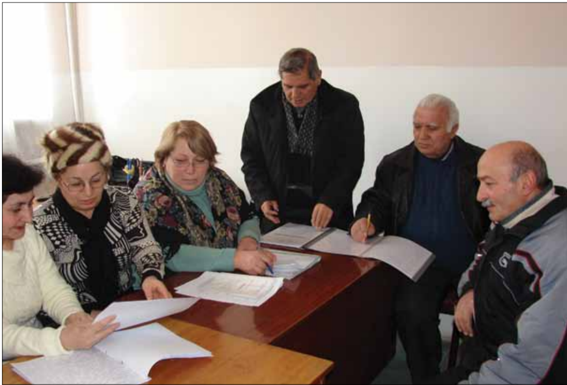
Ընդերքաբանության և մեթալուրգիայի ամբիոնի հերթական նիստը:

Յուրիստիկա 2. Քրոնիկական «Սյունիստայ» ԱՄՆԱՆԱԳԵՏՈՒԹՅԱՆ ԿԵՆՏՐՈՆ