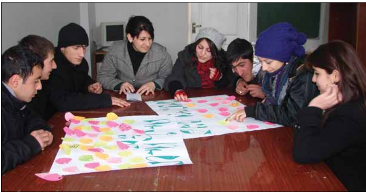
ՀԴՃ Կապանի մասնաճյուղի ուսխորհուրդը աշխատանքային հերթական ծրագիրը քննարկելիս:

Մեզ մոտ ուսման վճարը մայր բուհից ավելի ցածր է, դա էլ նշանակություն ունի: - Մարգարե, կարծեք, ինչ-որ վերապահում կա տեղական բուհերի շրջանավարտների նկատմամբ: Դա նկատել ենք հատկապես «Դինո գոլդ մայնինգ քամփին» ՓԲԸ-ում, երբ խոսք է բացվել Ձեր շրջանավարտների մասին: Դուք զգո՞ւմ եք գործատուների այդ զգուշավորությունը: - Դա նկատելի է հատկապես «Դինո գոլդ մայնինգ քամփին» հետ ունեցած հարաբերություններում: Այդ ձեռնարկության հետ մեր համագործակցությունը ոչ միշտ է ստացվում, նույնիսկ ուսանողներին այնտեղ արտադրական պրակտիկայի չեն ընդունում: Իսկ ՋՊՄԿ-ն, այդ առումով, ոչ մի խնդիր չի հարուցում, ընդհակառակը՝ բարձր արդյունավետությամբ կազմակերպում է ուսանողների արտադրական պրակտիկան և այդ ընթացքում նրանց ապահովում վճարովի աշխատանքով: - Դասախոսական կարգերի խնդիրն մենք հպանցիկ անդրադարձանք: Ի՞նչ որակներ պետք է ունենա մասնագետը, որպեսզի ՀԴՃ Կապանի մասնաճյուղում դասախոս աշխատի: - Դասախոս աշխատելու համար հաշվի ենք առնում նախ մասնագիտական կրթությունը (բակալավրիատ, մագիստրատուրա, ասպիրանտուրա), ինչպես և գիտական աստիճանը, դասախոսական աշխատանքի փորձը, կարողությունները, մանկավարժական հմտությունները: Իմ պաշտոնավարման առաջին տարում 125 ուսանող ունեինք, 11 դասախոս, որոնցից միայն երկուսն ունեին գիտական աստիճան: Այսօր ունենք գիտության 10 թեկնածու և դոկտոր: Տնտեսագիտական մասնագիտության գծով գիտության թեկնա-