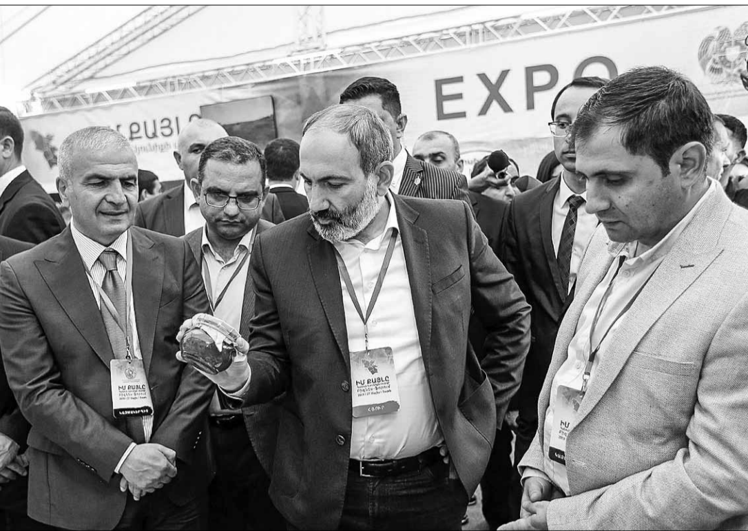
Մեկտեմբերի 24-ից հոկտեմբերի 5-ն անցկացվող ռազմավարական գործարարությունների ժամանակ