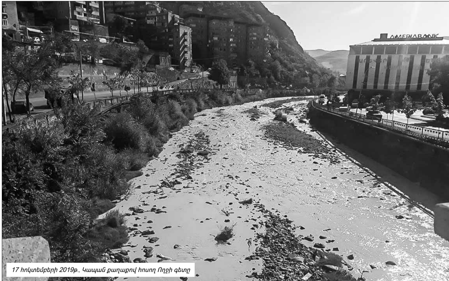
17 հոկտեմբերի 2019թ., Կապան քաղաքով հոսող Ողջի գետը