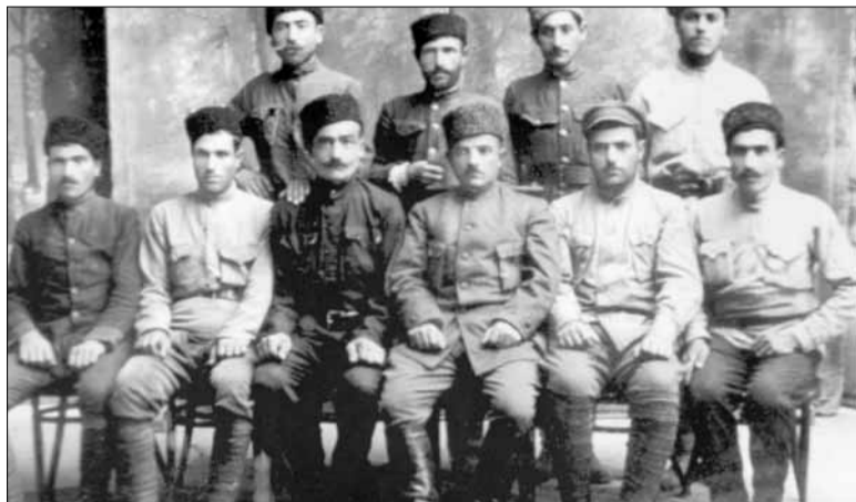
Առաջին շարքում, ձախից՝ չորրորդը Յապոնը

Նախորդ տարիներին Զանգեզուրում բացմիջ կրկնվող հայ-թուրքական զինված բախումներն ու գավառում տիրող իրական կացությունը հավաստում էին, որ Զանգեզուրը միայն տեղի մարտական ուժերով թուրք բնակչությունից մաքրելը չափազանց դժվարին խնդիր էր: ՀՀ կառավարությունը՝ հիմք ընդունելով այդ իրողությունը, Զանգեզուրի խնդիրը վերջնականապես լուծելու նպատակով եւ ի պատասխան Ադրբեջանի իշխանությունների կողմից Խոսրովբեկ Սուլթանովին Զանգեզուր-Արցախի գլխավոր նահանգապետ նշանակելու որոշմանը, գնդապետ Արսեն Շահմազյանի հեռանալուց հետո, Դրոյին նշանակում է Զանգեզուր-Արցախի նահանգապետ ու մարտական ուժերի ընդհանուր հրամանատար: ՀՀ կառավարության հրահանգով, Դրոն 1919 թ. դեկտեմբերի վերջերին 600 զինվորներով հասնում է Գորիս: Նրա ժամանումով զորահավաքի ու մարտական խմբեր կազմավորելու