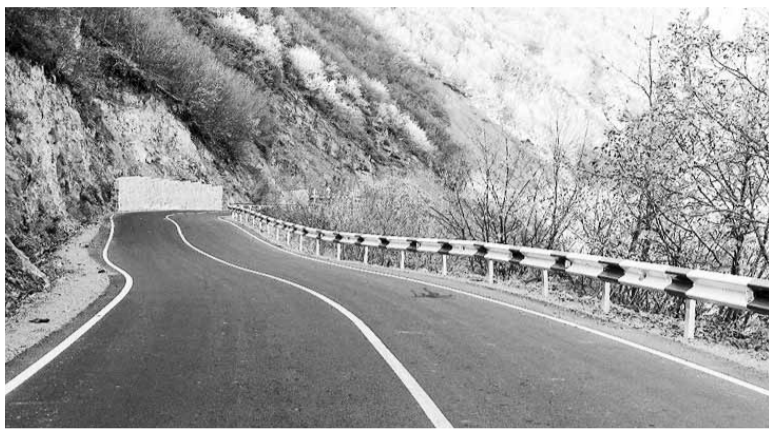
Սատանայի կամրջ-Տաթև մայրուղու հիմնանորոգումը կատարվել է «Տարածքային զարգացման հիմնադրամի» ծրագրով (ղեկավար՝ Աշոտ Կիրակոսյան) և Համաշխարհային բանկի ֆինանսավորմամբ:

Դեռևս 2010-ին պետք է հիմնանորոգվեր Սատանայի կամրջից մինչև Տաթև ընկած ավտոմայրուղին, երբ գործարկվեց Տաթևի ծոպանտղին: Սակայն վերաշինվեց միայն Ծինուհայր-Յալիծոր-Սատանայի կամրջը հատվածը: Ու միայն 2018 թ. աշնանը հաջողվեց շարունակել կիսատ թողածը: